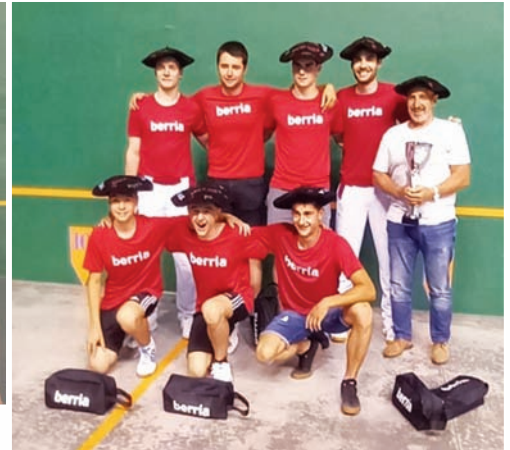
Equipo Oberena de mano campeón del Torneo Berria 2023

medalla de oro en el Campeonato del Mundo de Biarritz 2022. Igual que Santiago Yaniz, medalla de oro en la especialidad de frontball.